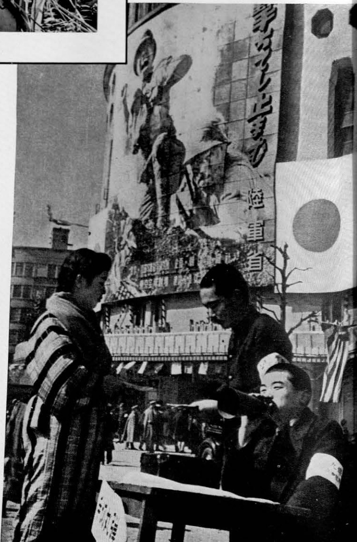
1961年・日劇ウエスタン・カーニバル