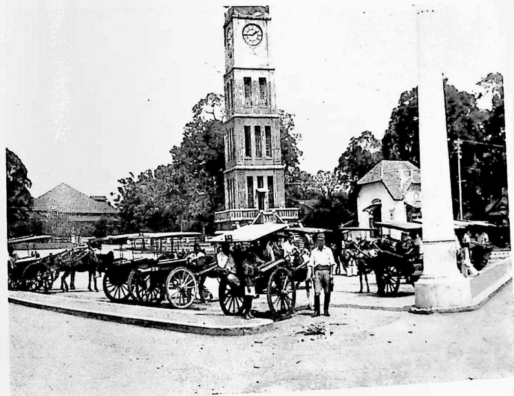
フォルトデコック 時計台広場