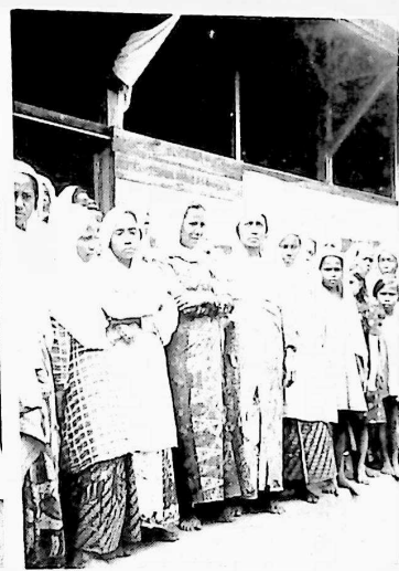
現住民の盛装した女性達