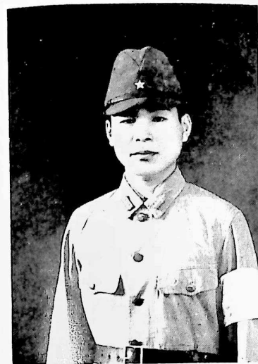
レンバンの補助憲兵