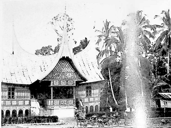
中部スマトラ トバ湖周辺の民家