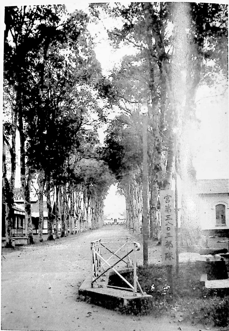
中部スマトラ フォルトデコック(ブキチンギ)の 近衛歩兵第四連隊兵営入口