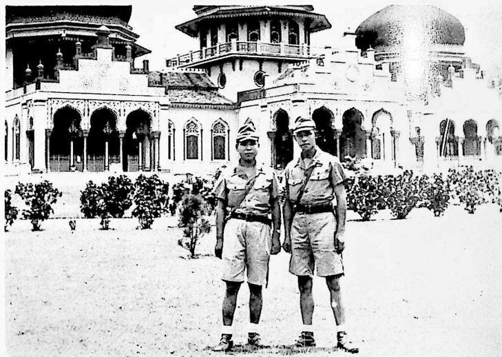
コクラジャ進駐当時 旧王宮前庭にて右O伍長 左私